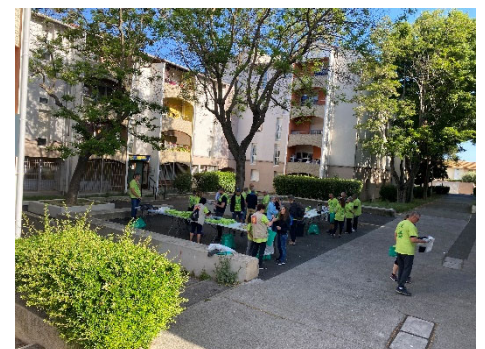
Dimanche 22/5/22: Vide-grenier