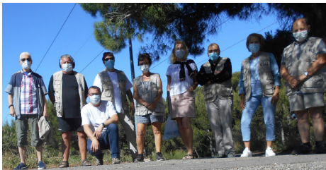
Mercredi 1 er juil. 2020 : Boulodrome.