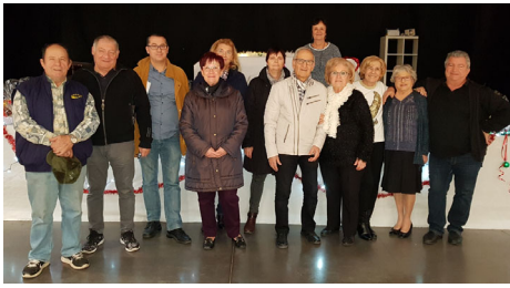
Samedi 25 janvier 2020 : Les rois.