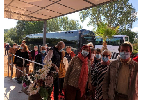
Samedi 20 nov. 2021 : Beaujolais.