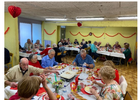
Samedi 30/04/2022 : Poulet fermier