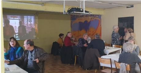
Vendredi 14 fév. 2020 : St Valentin.